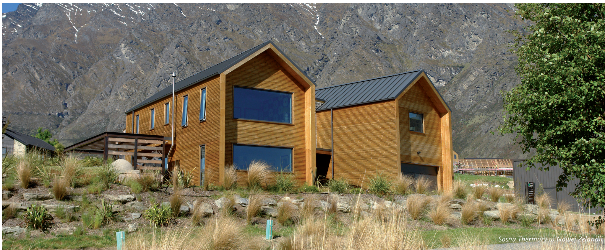
Sosna Thermory w Nowej Zelandii

Aby sprostać wszelkim wizjom i stylom Thermory oferuje 3 klasy sortowania: Natur, Rustic i Country. Wszystkie deski są sortowane jednostronnie.